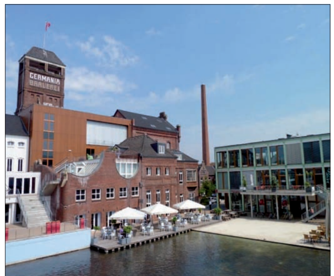
Abb. 2: Blick auf den „Zaubersee“, im Hintergrund Bestands- und Neubauten

die Facharzt Praxen weiter auszubauen sowie um gastronomische und freizeitbezogene Einrichtungen zu ergänzen. Die Wohnnutzung sollte sich insbesondere an die Zielgruppen der Studierenden (Wohnheimplätze in Trägerschaft des Studentenwerkes) und der Mittelklasse mit urbanem Lebensstil richten